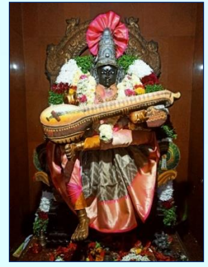
Sri Matre Namaha