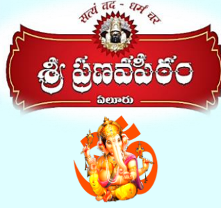
Sri Ganeshaya Namaha